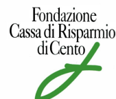
Fondazione Cassa di Risparmio di Cento